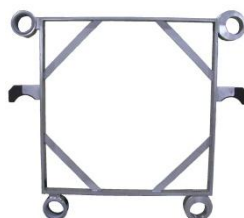
Рама фильтра из нерж. стали