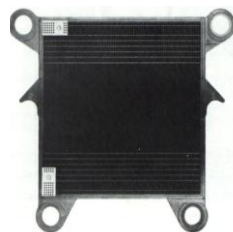
Пластина из пластмассы