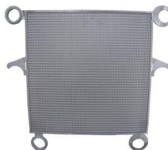
Пластина из нерж. стали